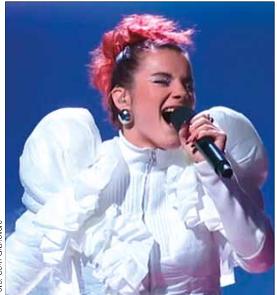
L'artista interpretant una cançó dalt de l'escenari