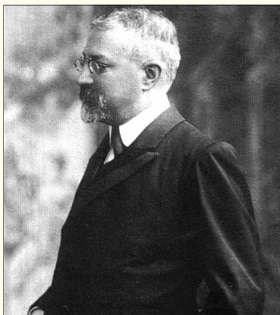
Lluís Domènech i Montaner (Barcelona, 1849 - 1923), arquitecte, historiador, humanista i polític. Va construir el Palau de la Música i l'Hospital de Sant Pau. Deixebles seus van ser Gaudí i Puig i Cadafalch. Va impulsar la Lliga Regionalista, partit que acabaria sent hegemònic