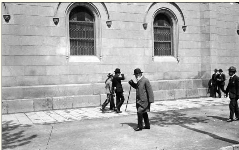
Antoni Gaudí i Cornet (Reus o Riudoms, 1852 - Barcelona, 1926), arquitecte i màxim representant del modernisme català (Sagrada Família, Casa Batlló, Casa Milà, Parc Güell...). De Gaudí hi ha molt poques imatges però fa poc es va descobrir aquesta fotografia inèdita en que se'l veu arribant a la Universitat de Barcelona