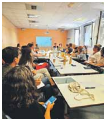
Aspecte de la reunió preparatòria

Durant la reunió, amb la presència de representants de totes les parts implicades, es va anunciar que El Cercallibres , que es fa en coordinació amb el CC El Sortidor, es realitzarà del 22 al 25 d'abril de 2024, amb la idea de construir el programa d'activitats partint de les gresolades i de la disponibilitat de les entitats socioculturals participants i els equipaments culturals que vulguin. També es va anunciar una novetat del programa: els itineraris per donar a conèixer les