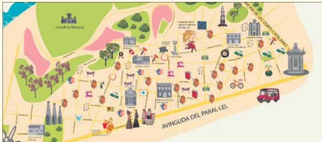
Mapa dels tallers artístics i artesanals del Poble-sec