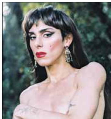
Foto s l'exposició 'Les insouciantes'