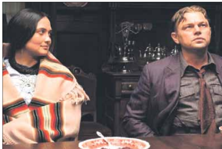
Lily Gladstone i Leonardo DiCaprio interpreten aquesta pel·lícula

Ernest Buckhart (Leonardo DiCaprio) torna als Estats Units després de lluitar en la Gran Guerra. El seu oncle William Hale (Robert De Niro) l'acull a casa seva, enmig de les terres que pertanyen als Osage, en l'actual Oklahoma. Aquesta tribu s'ha convertit en la població amb la major renda per càpita del planeta gràcies als pous de petroli que infesten el seu territori. Ernest coneix i s'enamora de Mollie Kyle (Lily Gladstone), una autèntica Osage que viu amb la seva mare i germanes. Les malalties i també els assassinats que comencen a succeir deixen