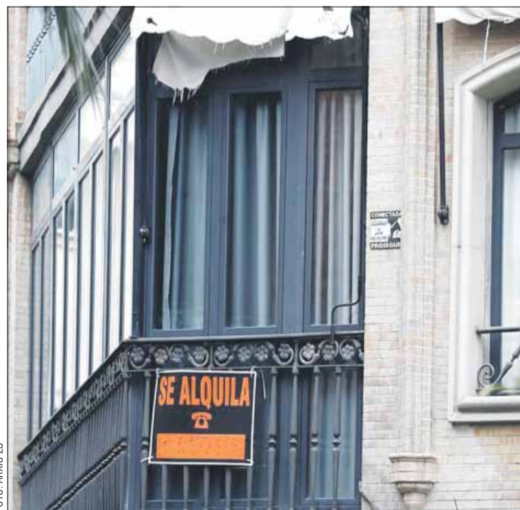
El lloguer segueix sent un gran mal de cap per a la ciutadania

En el cas concret del Poble-sec i en relació amb el preu del metre quadrat de lloguer, aquest s'ha encarit un 54,1% en deu anys. Segons les dades de l'Incasòl, mentre que l'any 2014 aquest tenia un valor de 10,19 euros, enguany ha pujat fins als 15,70 euros. ■