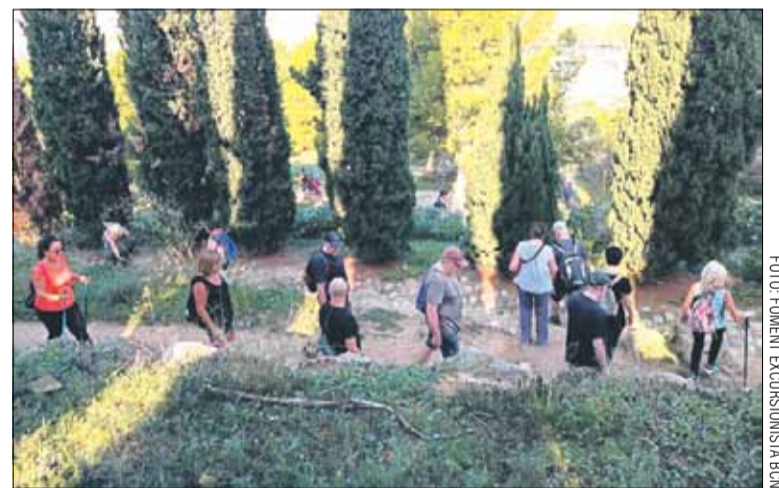
Membres del Foment Excursionista de Barcelona inaugurant el sender

El camí definitiu forma part del pla director de camins del Parc de Montjuïc elaborat per l'Ajuntament de Barcelona, però la iniciativa va sorgir per part de l'entitat excursionista durant el confinament, i es registrarà amb el número PR-C229. Des del Foment Excursionista de Barcelona, però, informen que aquesta no serà la inauguració definitiva, ja que hi ha un tram que està inaccessible per obres. ■