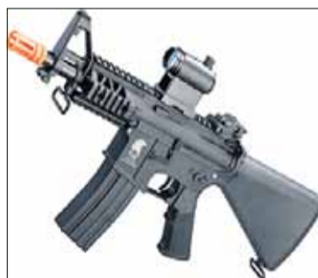
Exemple d'arma d'airsoft

En aquest sentit, la patrulla ha indicat a la víctima que la forma de procedir és desplaçar-se al CAP per aconseguir el preceptiu informe mèdic i, posteriorment, presentar denúncia als Mossos d'Esquadra. Una diligència que no ha satisfet gens el ciclista, ja que, segons ha criticat, els agents de la policia municipal "ni tan sols s'han baixat de la moto" per observar l'estat de la seva cama, quan ell esperava una primera intervenció preventiva.