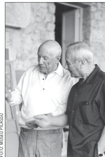
Pablo Picasso i Joan Miró

L'exposició s'organitza al voltant de sis grans eixos cronològics i temàtics i aplegarà