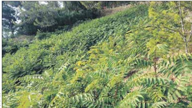
L'Institut Botànic de Barcelona alerta de les plantes exòtiques