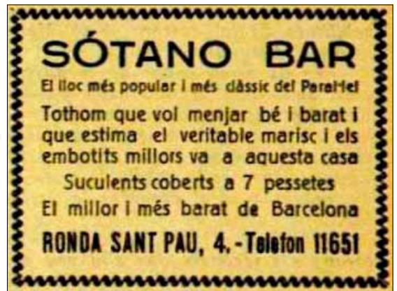
1930. Publicitat del Sótano Bar a la revista satírica 'Papitu'

GRAN MUSIC-HALL L'AS. El 6 de setembre de 1921 una nova empresa va fer-se càrrec del local conegut fins aleshores com a Madrid-Concert i va reobrir-lo