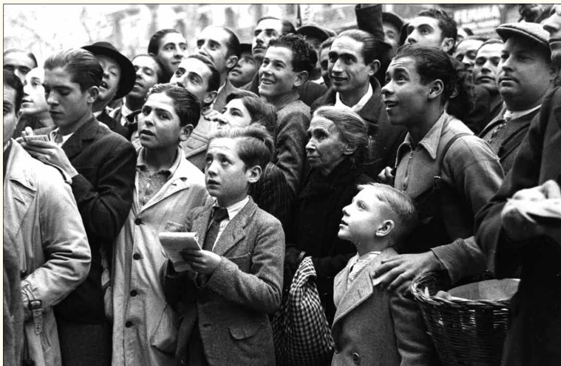
21 de desembre de 1935. La rifa de Nadal. Grup de gent esperant els resultats de la grossa