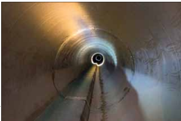
Vista de l'interior d'un col·lector com el del carrer de Vila i Vilà

Les obres d'aquest col·lector aniran des de la plaça del Molino fins al carrer de Palaudàries, i el carrer de Vila i Vilà es tallarà per trams en l'execució de les diverses fases de l'obra, de primer per construir-hi pilons i murs de contenció soterrats i desviar les canalitzacions existents. Després, per fer el nou col·lector. El