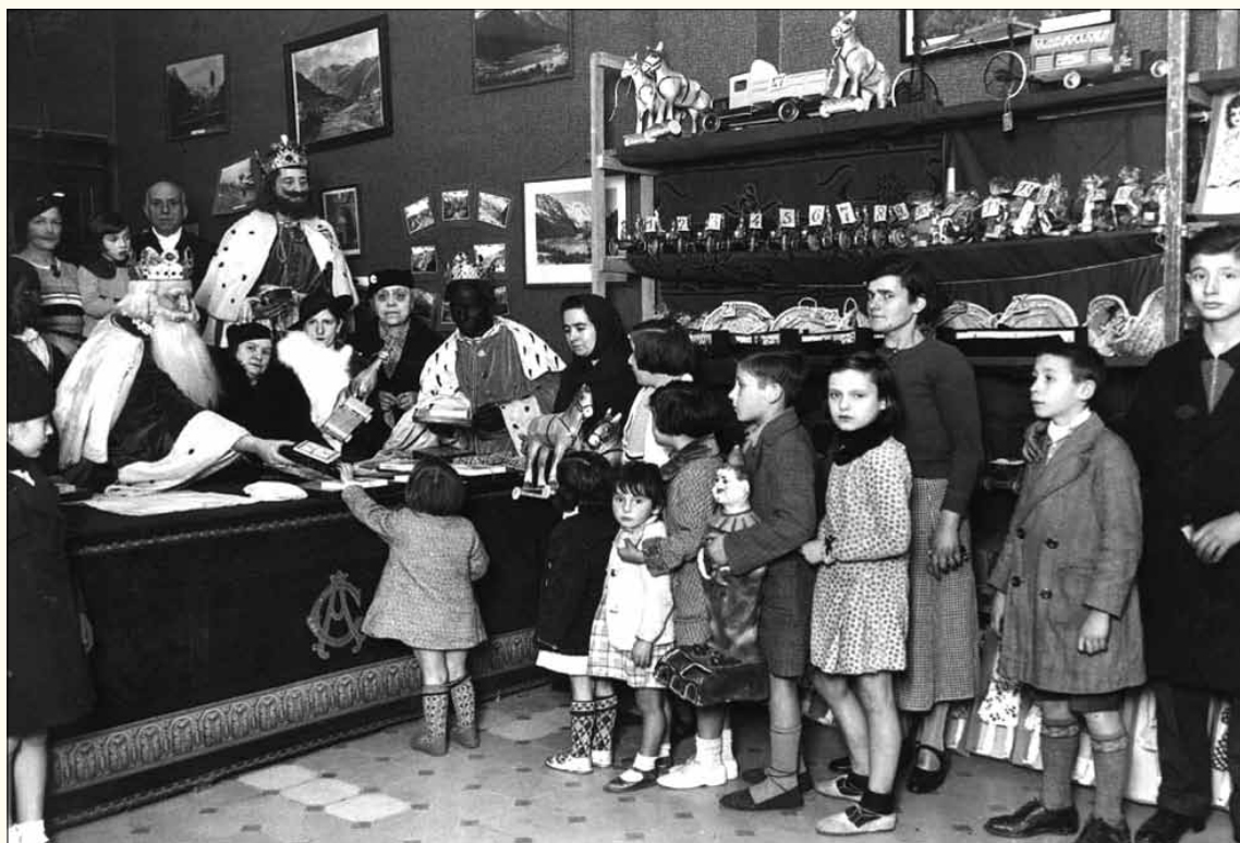
6 de gener de 1936. Diada de Reis. Repartiment de joguines als infants necessitats al Centre Aragonès / Pérez de Rozas