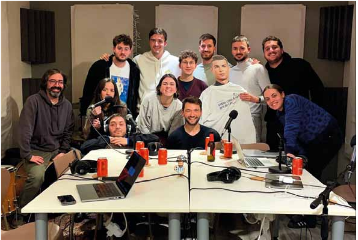
L'equip, i més, de Desobediència Cruyffista a l'estudi d'enregistrament del pòdcast

programa i l'enfocament que volem donar-li. El que més costa, a vegades, és tenir inspiració, per això varia molt el temps que dediquem cada setmana. Ho tenim tot molt planificat. No obstant això, el que més feina ens dona és treballar diàriament en el manteniment de les xarxes socials. Pengem clips a Instagram i TikTok, i sempre fem una bona selecció del que volem publicar. Ara bé, tot i la feina, val la pena fer possible cada cosa.