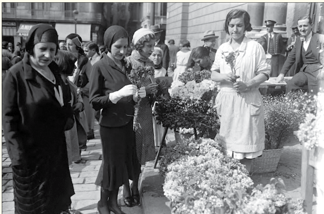
1931. Tres dones compren flors en una parada instal·lada davant del Palau de la Generalitat de Catalunya, amb motiu de la celebració de la festa de Sant Jordi, a la plaça de la República (Sant Jaume).