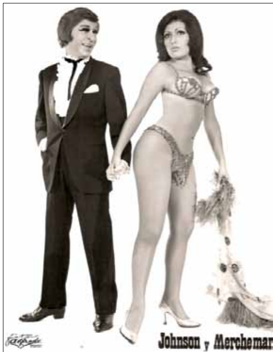
Una parella icònica d'El Molino

gran popularitat que tenia, de què arribés a ser model de Salvador Dalí i que tingués una estàtua al Museu de Cera de Barcelona.