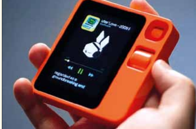
El Rabbit R1, un 'majordom' electrònic al palmell de la mà

Si volem saber si hi ha bicicletes disponibles a l'estació Bicing més propera hem de cercar l'app Smou de l'Ajuntament, fer clic per obrir-la, mirar el plànol, veure si hi ha bicicletes, fer clic sobre la disponible i clicar de nou per reservar. Tot són botons, desplegable, escriure en un teclat on els dits no caben... Però què proposa Rabbit R1? Treure'l de la butxaca, prémer el botó de parlar —a l'estil walkie-talkie — i dir-li quelcom similar a: "Busca'm una bicicleta propera i reserva-la!", i Rabbit respondria: