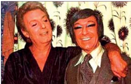
Escamillo i Johnson, dos gegants dels escenaris