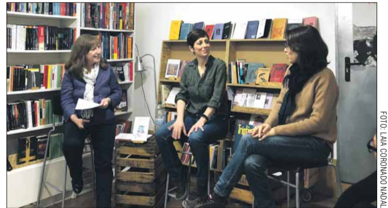
Les escriptores a la llibreria La Carbonera