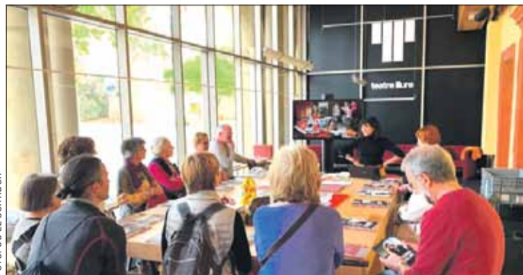
Activitat itinerant 'Montjuïc, un llibre obert' a l'Arxiu del Teatre Lliure