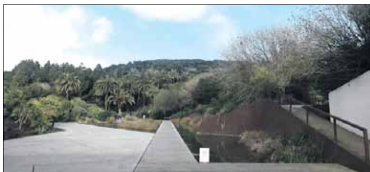
Accés al Jardí Botànic de Barcelona

De fet, no fou fins a 1930, aprofitant els treballs d'enjardinament de la muntanya de Montjuïc, inherents a la celebració de l'exposició