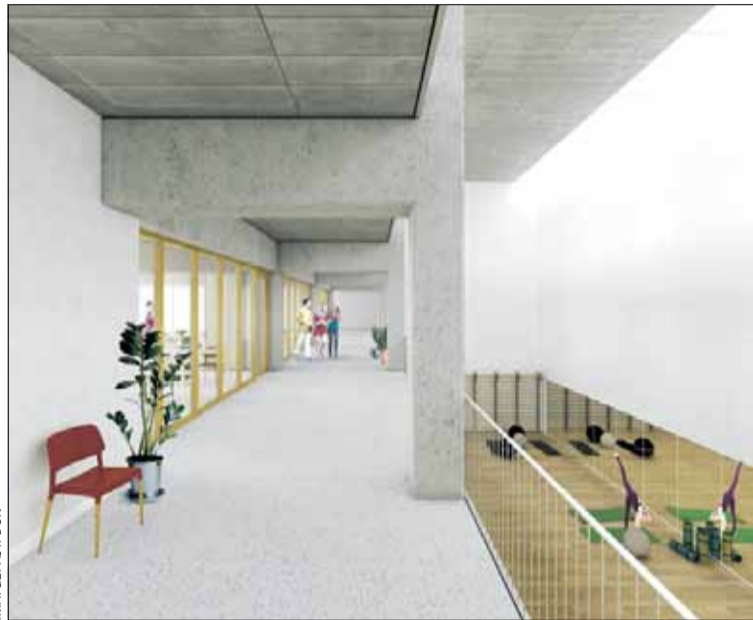
Recreació virtual de com seria l'interior de l'Institut d'Esports

Respecte a les raons per les quals s'han aturat les obres, fonts del centre educatiu assenyalen que des del juliol "no han fet més que arribar informacions contradictòries". Una situació en