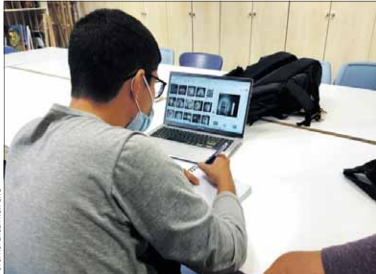
Un dels usuaris treballant amb l'ordinador

A mesura que passen els anys, neixen més nens autistes. La xifra s'ha incrementat considerablement; tot i això, les ajudes són quasi nul·les. "Les contribucions són completament insuficients. El col·lectiu d'autistes som els únics que fem coses. Ni l'Ajuntament ni la Generalitat ens donen un cop de mà. Es creuen que podem sostenir-nos de l'aire? No arribem tan lluny com volem perquè no tenim recursos. Això sí, el 2 d'abril l'Ajuntament s'il-