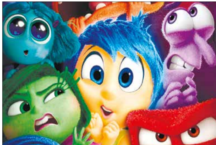
Un altre èxit de la factoria Pixar amb noves emocions

Riley Anderson (veu original de Kensington Tallman) ja no és una nena, ja té tretze anys. En la seva ment cinc emocions de la seva infantesa: l'alegria, la tristesa, la ràbia, la por i el fàstic guien les seves accions quan tot comença a trontollar. Els seus millors dos amics no aniran al mateix institut que ella, així que el comandament encapçalat per Alegria ha de decidir entre mantenir-la lligada als vells amics o preparar-la per a una nova etapa. Un nou grup d'emocions els desplaça abruptament. El membre més intens és Ansietat, que ve acompanyat d'Avorriment (amb el seu accent francès), Vergonya (amagada en la seva dessuadora amb caputxa)