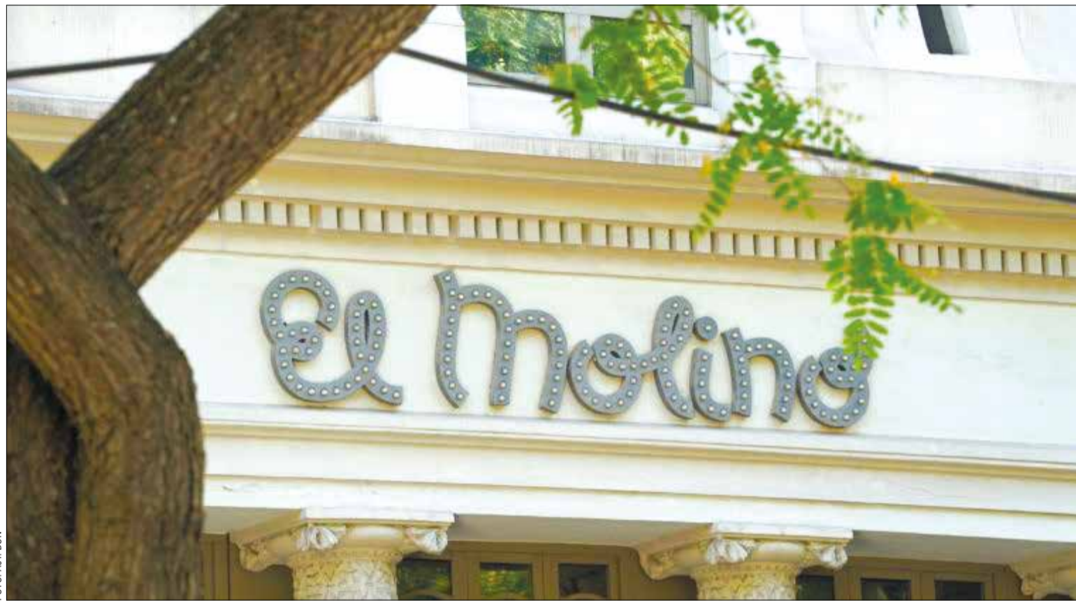
L'aspecte icònic de l'edifici no mutarà malgrat els canvis que pugui fer la nova gestió

Val a dir, però, que la nova gestora encara no té cap director de l'equipament decidit i que a dia d'avui a LinkedIn tenen una oferta oberta per cobrir aquesta plaça vacant (a hores de tancar aquesta