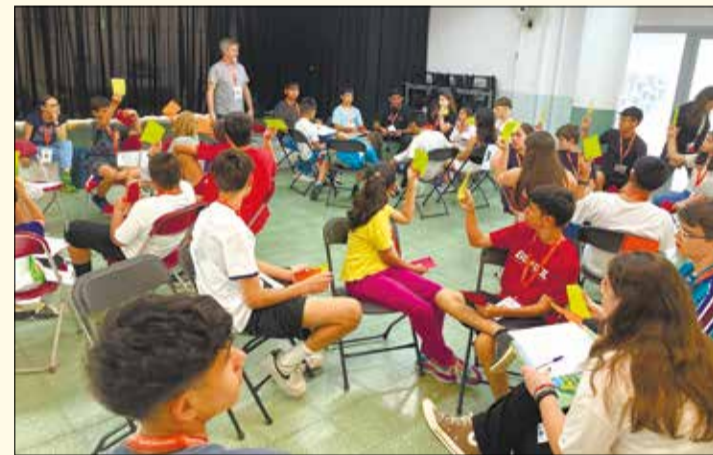
Aprent a conèixer i estimar el barri

ESCOLA MARISTES ANNA RAVELL www.annaravell.maristes.cat Tel. 934 425 027