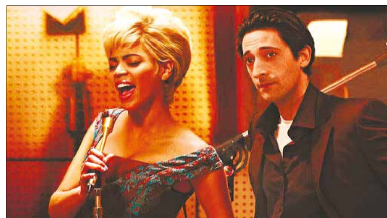
Fotograma de la pel·lícula 'Cadillac Records'

re el talent que surt dels bucs d'assaig. Primer amb La Fibra Subtropical (10 de juliol), un grup que fusiona ritmes afro-latinoamericans, urbans i balcànics, i després amb Lugar Comum (17 de juliol), que ens proposen un viatge per la bossa nova, la samba i el choro de la música brasilera. El 22 de