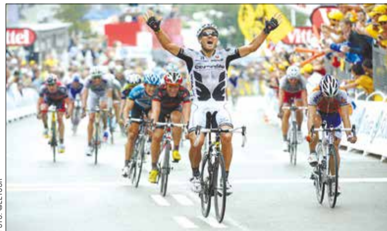
Thor Hushovd entra victoriós en la darrera etapa del Tour a Barcelona el 2009

L'última vegada que el Tour de França va rodar pels carrers de Barcelona va ser l'any 2009. Mentre que el 9 de juliol la ciutat va ser línia de meta per a l'etapa que partia de Girona (la victòria se la va emportar el ciclista Thor Hushovd), l'endemà l'escamot va partir direcció Andorra. Anys abans, el 1957 i el 1965, la ciutat també va acollir diferents etapes. ■