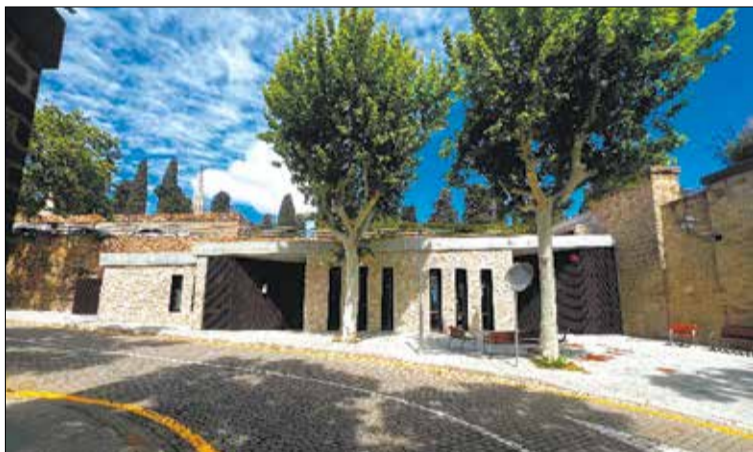
L'antiga sala s'ha reacondicionat per als nous serveis