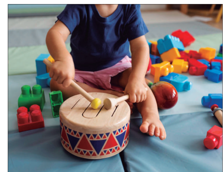
Actualment el carrer d'Elkano presenta un

Entre les novetats en l'àmbit musical hi ha “Disseny sonor amb sintetitzadors analògics” i una nova edició del curs de “Fotografia musical”. A més, el programa inclou