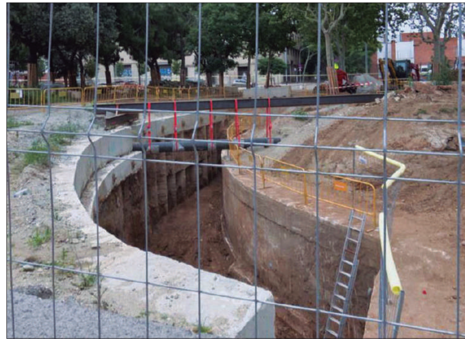
El punt de les obres on s'han trobat les restes arqueològiques

● La troballa s'ha produït arran les obres de reforma de les Hortes de Sant Bertran, les quals segueixen en marxa