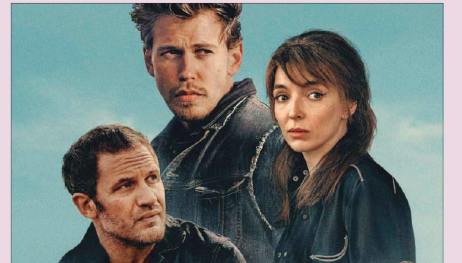
Cartell de la pel·lícula 'The Bikeriders'

'The Bikeriders' reflexiona sobre una època de canvis culturals i de l'inici de la degradació dels ideals