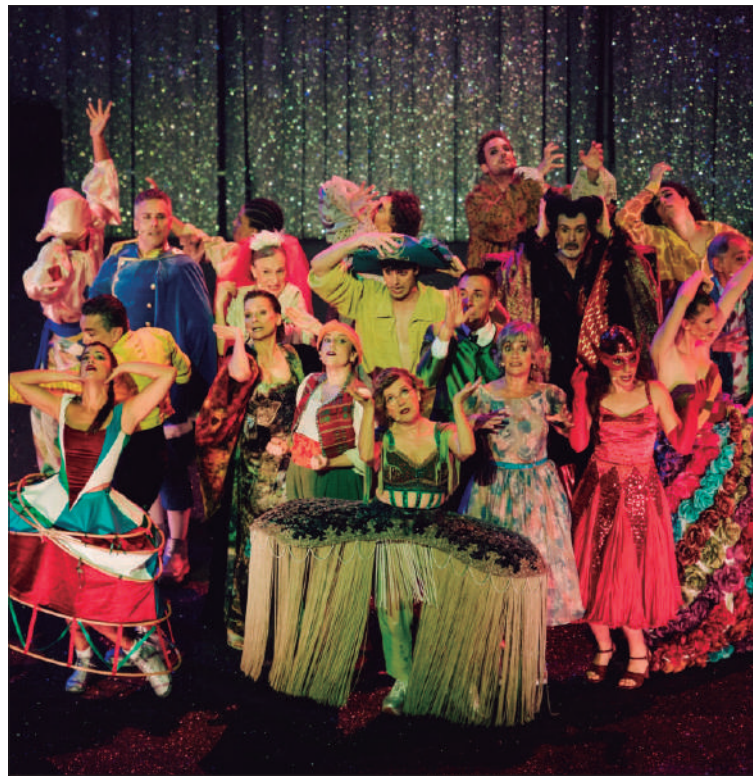
El comiat de Dagoll Dagom també va exhaurir entrades

l'escena local i internacional que ja havien passat en edicions anteriors pel Festival", expliquen. Aquestes propostes ar-