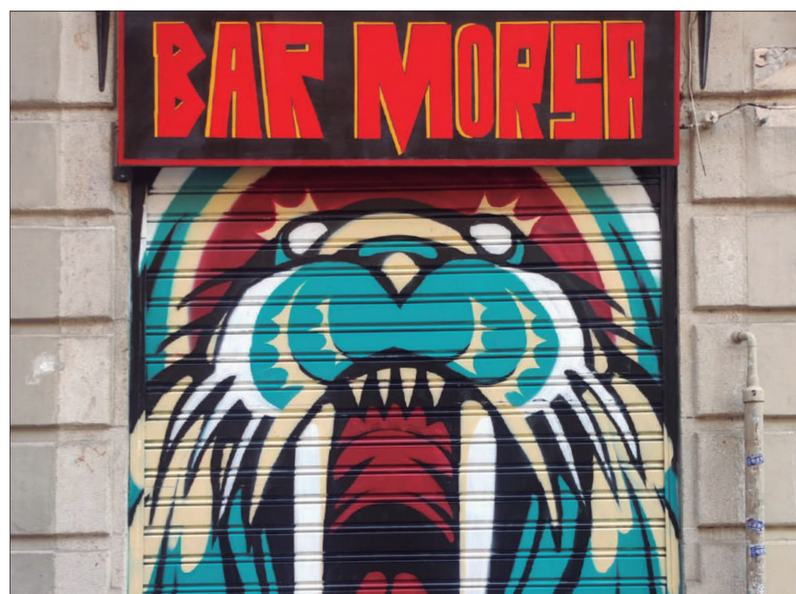
Persiana del Bar Morsa, ubicada al número 152 del carrer Nou de la Rambla