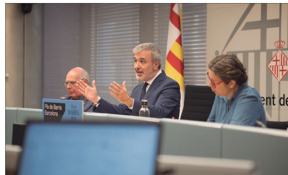
Roda de premsa de presentació del Pla de Barris

L'Ajuntament de Barcelona torna a incloure el Poble-sec entre els barris que rebran una injecció econòmica extraordinària. L'alcalde de Barcelona, Jaume Collboni, ha confirmat que el Poble-sec continuarà dins del programa Pla de Barris 2025 - 28. Una permanència que suposarà el manteniment de les inversions extraordinàries al territori per revertir les desigualtats i la degradació de determinades zones del nucli urbà. Si bé el regidor del Pla de Barris, Lluís Rabell, ha assegurat que des del Govern municipal ja existeix un esbós de quines intervencions es volen executar al llarg del mandat, també ha exposat que aquestes