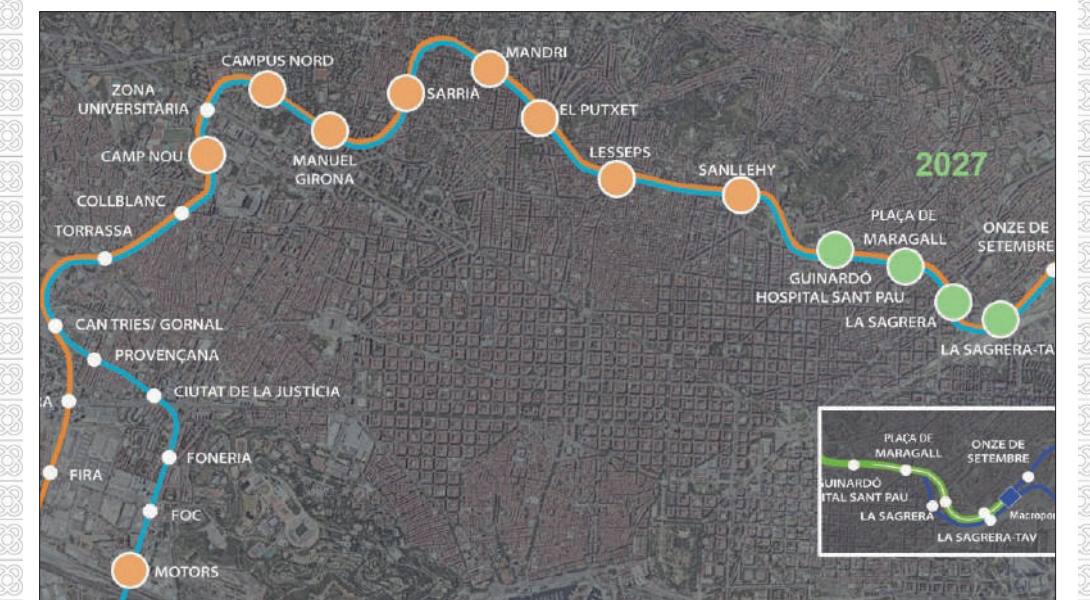
En taronja, estacions pendents; en verd, estacions previstes pel 2027

construeix al llarg d'un any sencer la peça sencera i s'instal·la durant dos mesos més. Un cop la tuneladora torni a estar en funcionament, tindrà pel davant 1,6 quilòmetres a perforar (els que hi ha entre Mandri i Lesseps). Aquesta afectació suposarà un nou sobrecost de 12 milions d'euros. Cal tenir en compte que l'anhelada connexió dels dos túnels no suposarà que totes les estacions ja estiguin en funcionament l'any 2030.