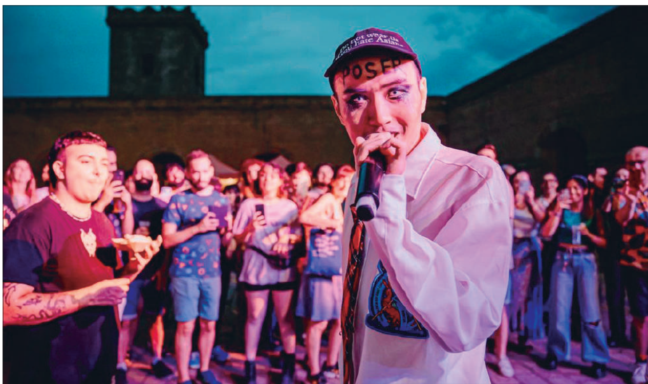
El pati d'armes del castell es convertirà en una sala de concerts a l'aire lliure cada divendres

MÚSICA La Sala BCN del castell de Montjuïc i el Poble Espanyol concentren el gruix dels escenaris a l'aire lliure P. 3