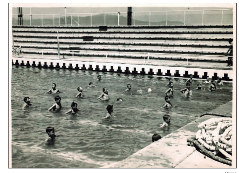
UN DELS PRIMERS CURSSETS, ABANS DE LA REFORMA DE 1955

columnes de suport i una contra-grada, al davant de l'existent. Aquesta contra-grada s'eliminaria amb els Jocs Olímpics de 1992. La millora de la piscina també serviria per a crear la nova secció de gimnàstica, aprofitant el gimnàs de l'espai reformat. El 1957 ja serien 1.000 socis i pel juliol de 1966 s'inaugura la piscina coberta de la plaça de Folch i Torres, de propietat municipal, però cedida al Club. Amb aquest equipament, la base social arribaria als 3.000 socis; i el 1970, més de 5.000.