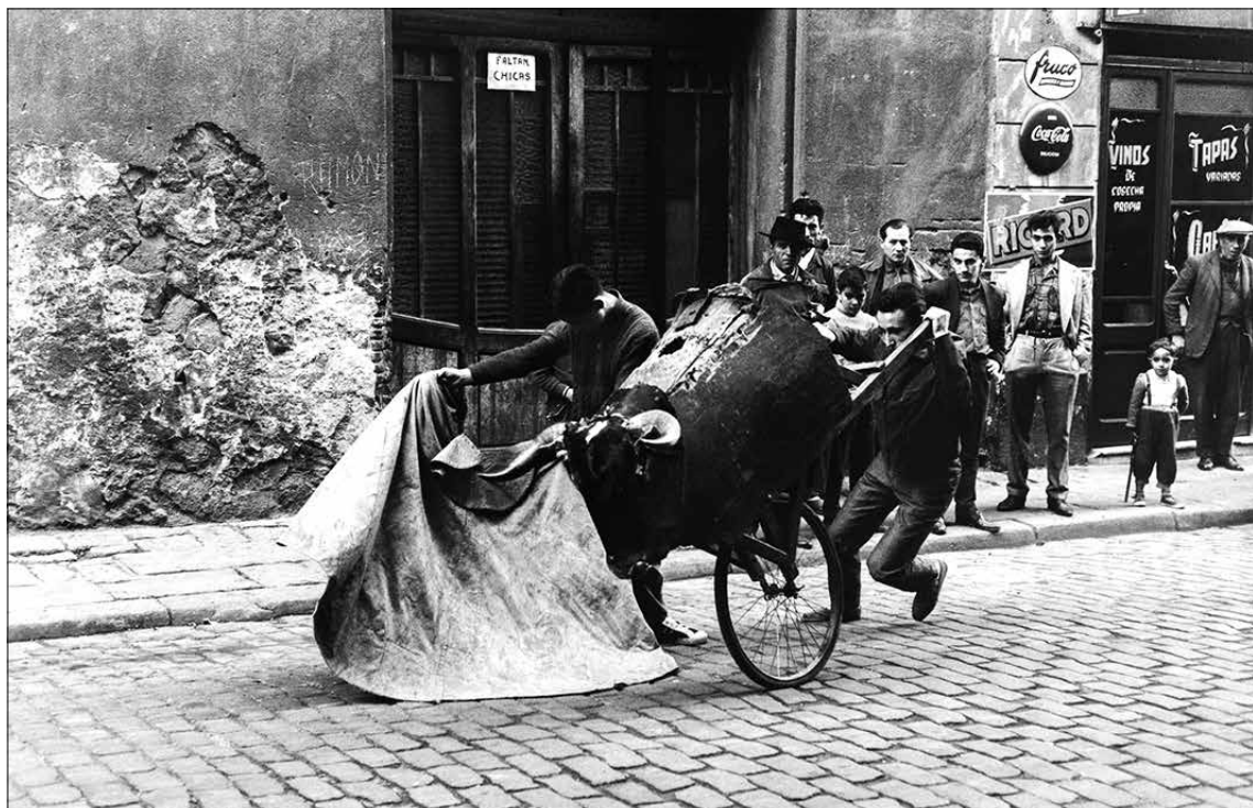
Torejant als carrers del Poble-sec. Fotografia d'Oriol Maspons per al llibre 'Toreo de salón' (1963)

ha la Fundació Joan Miró. Els toros, la boxa, el ciclisme i el futbol, populars de dècades abans, es veien com activitats que podien propiciar sortides laborals i l'èxit social; o això pensaven. Miquel Cartisano a Las sombras se equivocaron de dueño (Emboscall, 2017), que va passar la infantesa a Can Valero, ens ho descriu en el seu magnífic relat: "...si la lluvia sólo quedaba en promesas, nos acercábamos hacia el mirador, a ver si por casualidad los aprendices del toreo peleaban contra unas ruedas disfrazadas con cuernos. En no pocas ocasiones y a cada pase que daban, si la cosa les salía bien y la capa no se les enredaba con la rueda, acompañábamos