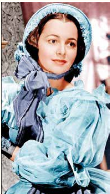
1939. Olivia de Havilland interpretant el paper de Melanie a 'Allò que el vent s'endugué'. Un paper per a la història