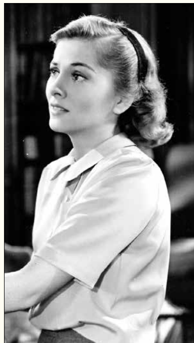
1940. Joan Fontaine a 'Rebecca', d'Alfred Hitchcock, pel·lícula que la va immortalitzar a la història del cinema