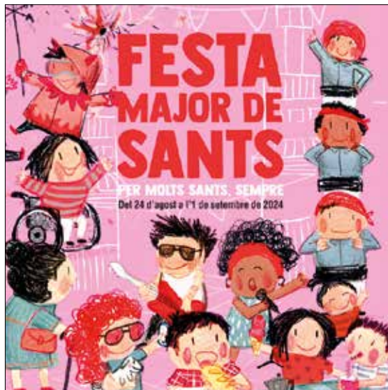
El cartell és obra de la il·lustradora Susana Soto

Entre els escenaris de la festa es mantenen el parc de l'Espanya Industrial, on es tornarà a fer el pregó, el lliurament de premis del concurs de carrers i el ja tradicional piromusical que tanca la festa major; l'Espai Castellers a la plaça de Can Climent on es viuran els concerts de festa major; les Cotxeres de Sants on es podran seguir les partides de l'Open d'Escacs i la plaça Bonet i Muixí.