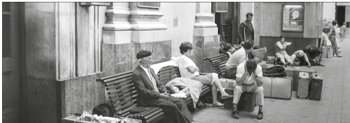
Emigrants a l'Estació de França. Fotograma d'«El largo viaje hacia la ira» (1969), de Llorenç Soler

Alguns nois del Poble-sec, no necessàriament fills d'emigrants, també s'hi animaven i era habitual veure'ls pels carrers i els terrats del barri onejant muletas i capotes . O a la desapareguda plaça del Sol, on avui hi