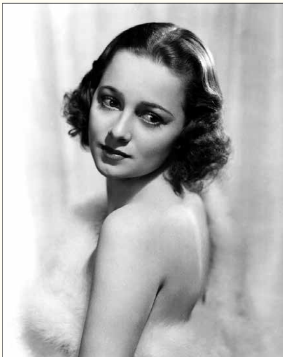
Olivia de Havilland (Tòquio, 1916 - París, 2020) va ser una actriu britànica, naturalitzada estatunidenca nascuda al Japó, on treballava el pare. Germana gran de l'actriu Joan Fontaine. Va guanyar dos Oscars i dos Globus d'Or