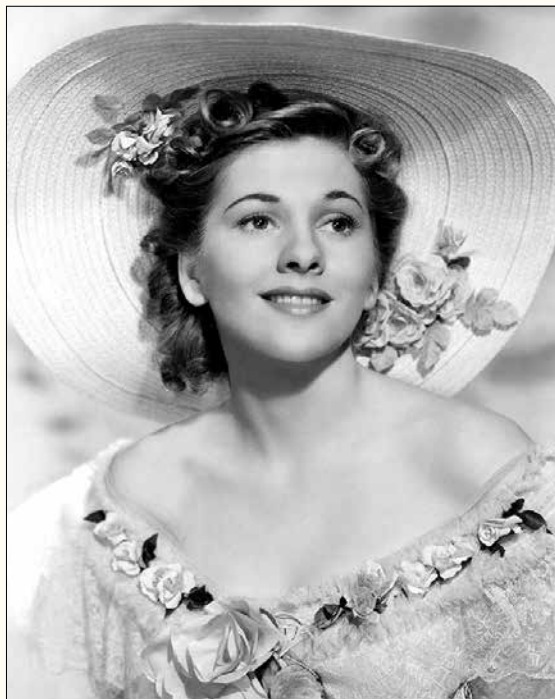
Joan Fontaine (Tòquio, 1917 - Carmel, Califòrnia, 2013) va ser una actriu britànica, naturalitzada estatunidenca. Germana petita d'Olivia de Havilland, amb qui va estar en conflicte permanent. Va guanyar un Oscar per 'Sospita'