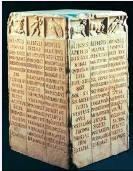
El mesos romans gravats en pedra

Respecte als noms dels mesos de julius i augustus, aquests no van ser acceptats immediatament per la població, ho prova el fet que en escrits medievals encara es feia servir els noms originals de quintilis i sextilis. Finalment, però, van triomfar i han arribat fins als nostres dies. REDACCIÓ