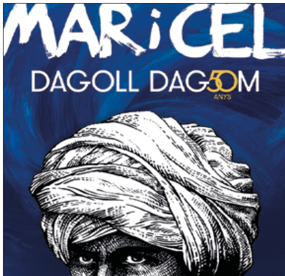
Dagoll Dagom fa 50 anys i plega amb el millor ‘Mar i Cel’