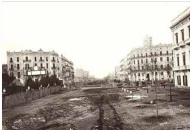
1874. La Gran Via de les Corts Catalanes

L'any 1906 la Comissió de l'Eixample va decidir acabar amb el mal estat de les voreres, obligant a pavimentar-les en tota la seva amplada. Alhora, es va unificar el mètode de pavimentació, imposant els panots de ciment hidràulic, amb cinc dissenys diferents. El novembre de