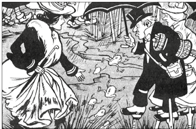
Portada de 'L'Esquella de la Torratxa' del 23 de gener de 1903, considerada l'origen del malnom Can Fanga

Tampoc van ser satisfactòries les proves amb l'asfalt natural o betum. En algunes zones, com la ronda Sant Pere i el carrer Pelai, fins i tot es va experimentar