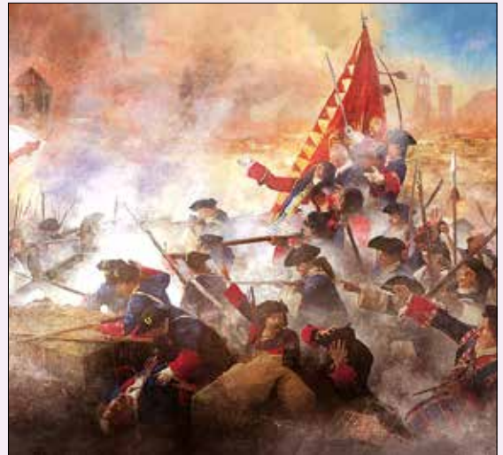
11 de setembre de 1714, últim dia del penó militar de Santa Eulàlia en mans catalanes

cremar-les públicament. Increïblement, un fragment de la bandera va ser rescatat de la destrucció i es va poder visitar a l'exposició Fins a aconseguir-ho! El setge de 1714 al Born Centre Cultural. ENRIC MESTRES