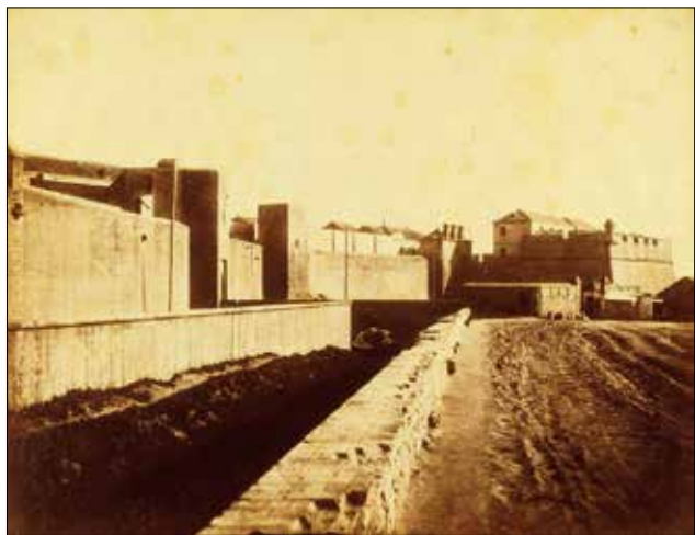
1860-1870. La muralla de terra, el portal de Santa Madrona i el baluard del Rei

Quan el 1890 s'enderroca el baluard del Rei, la continuïtat del passeig de Colom cap al sud permet l'accés a l'ampliació del port; però també la comunicació amb el Morrot, Can Tunis i Montjuïc. I, a més, fa possible l'obertura d'una nova arteria ciutadana, el Paral·lel, per connectar el port amb la Gran Via i l'Eixample. També