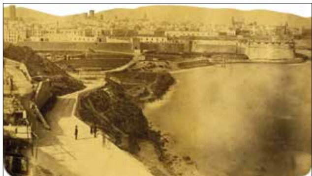
1852. Platja de Sant Bertran, portal de Santa Madrona i baluard del Rei des del Morrot

permet fer el recorregut complet de circumval·lació de la Ciutat Vella, en una línia de tramvies i autobusos de bon record: el 29. Així fa que la primera urbanització del Paral·lel tingui primordialment un sentit de mar cap a Sants; i sobretot fins al voltant de la bretxa de Sant Pau. Així, les primeres cases són els números: 96, actualment un edifici dels anys 70 del segle XX; 92, edifici de 1874, encara existent; i 90, de 1881, també en peu.