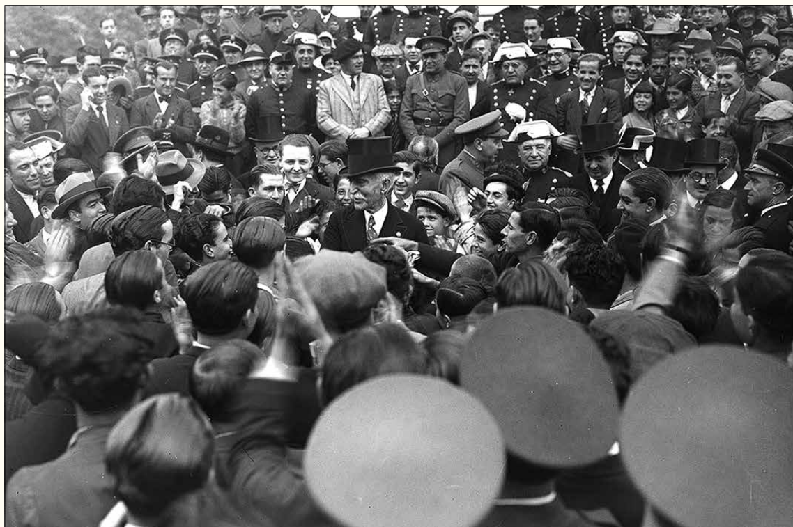
1933. Francesc Macià envoltat per una multitud en la commemoració del segon aniversari de la proclamació de la República