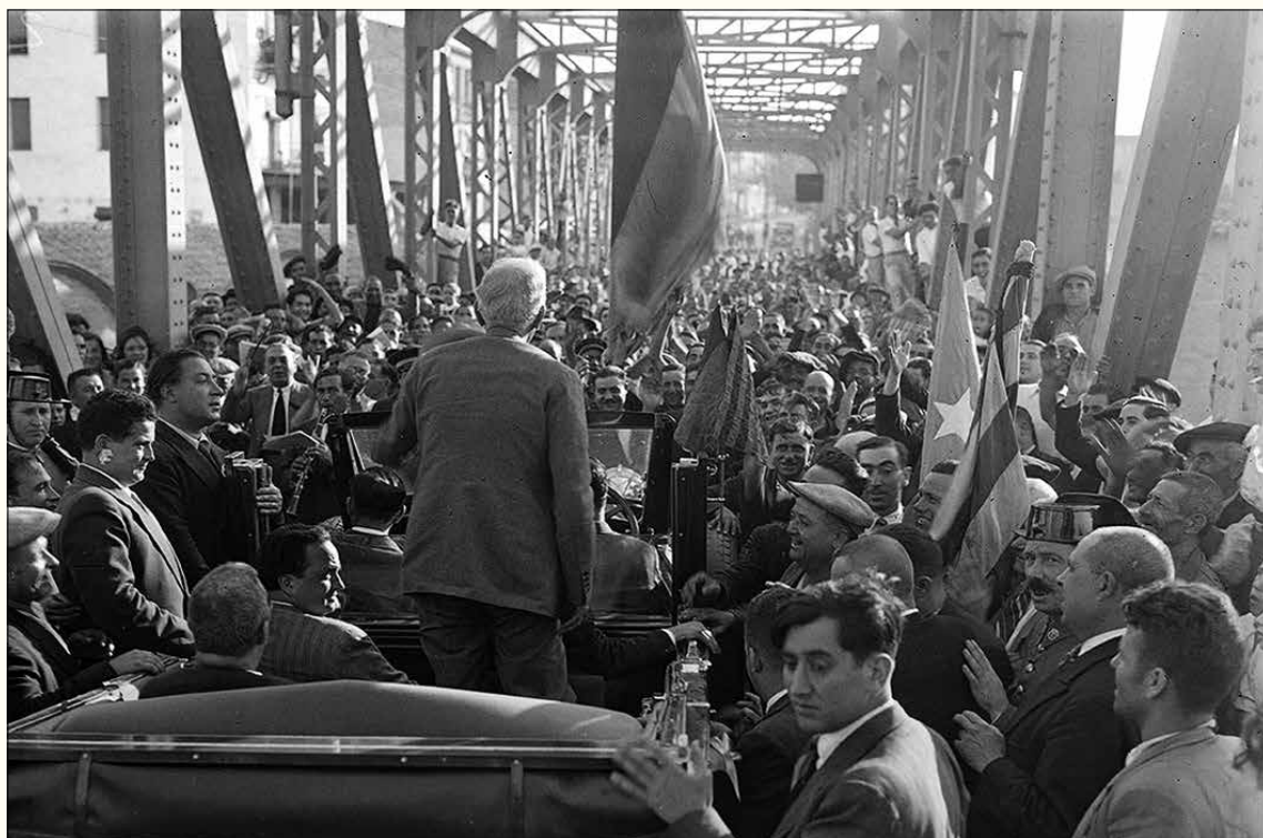
1933. Visita del president de la Generalitat, Francesc Macià, a Móra d'Ebre