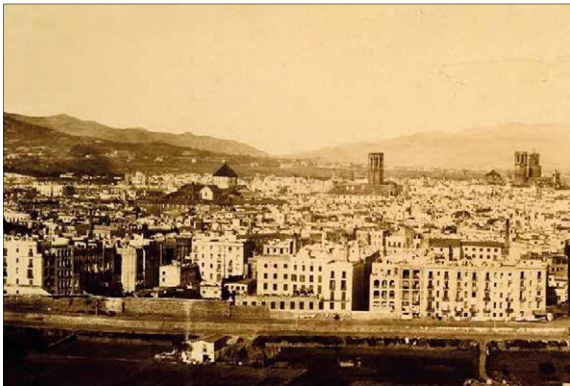
1860. El futur Paral·lel, vist des de la muntanya de Montjuïc

El límit inferior del projecte era una avinguda que Cerdà, provisionalment, denomina Paral·lel i que unirà el port amb Hostafrancs