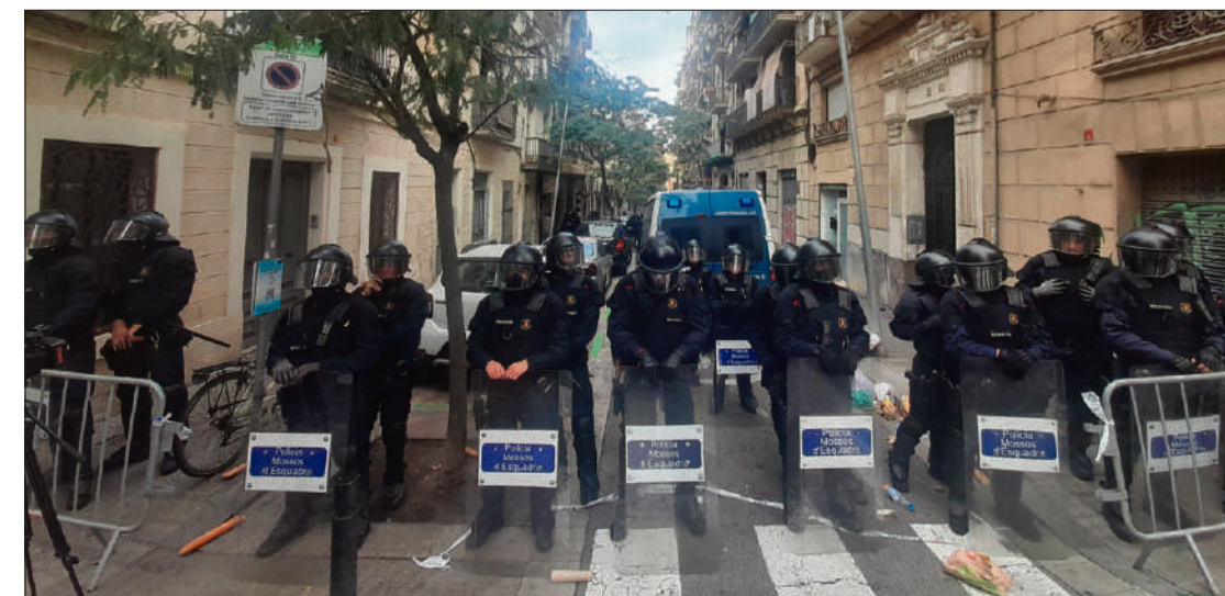
Desenes d'agents de la Brimo dels Mossos d'Esquadra, per desnonar dues persones