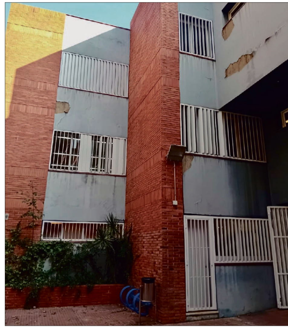
Algunes parts de la façana de l'Institut estan malmeses i amenacen amb caure

Tot i aquestes primeres setmanes, l'Institut ha aconseguit superar la fase crítica. Des del 23