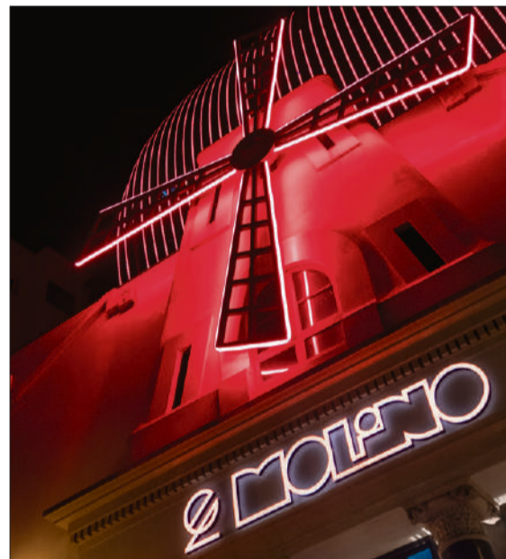
Les aspes del mític edifici tornen a girar AJUNTAMENT DE BCN

El Molino celebra una festa d'inauguració abans d'encetar una nova etapa musical P. 10