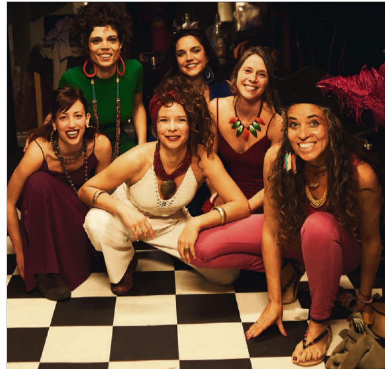
Maracuyá, integrat per artistes llatinoamericanes i europees

Aquest novembre torna el cicle dels Concerts de la carbonera del Centre Cultural Albareda, on conèixer grups de música que assagen als bugs de l'equipament musical del Poble-sec. Tres cites on podrem gaudir de música en viu amb propostes ben diferents. Els concerts seran els divendres indicats a les 20 hores i amb entrada gratuïta.