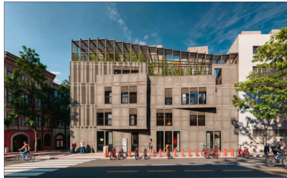
Recreació virtual de l'edifici que s'aixecarà al número 38 del passeig de l'Exposició

● La iniciativa busca ser una opció constructiva per a aquells solars petits que descarten les grans promotores