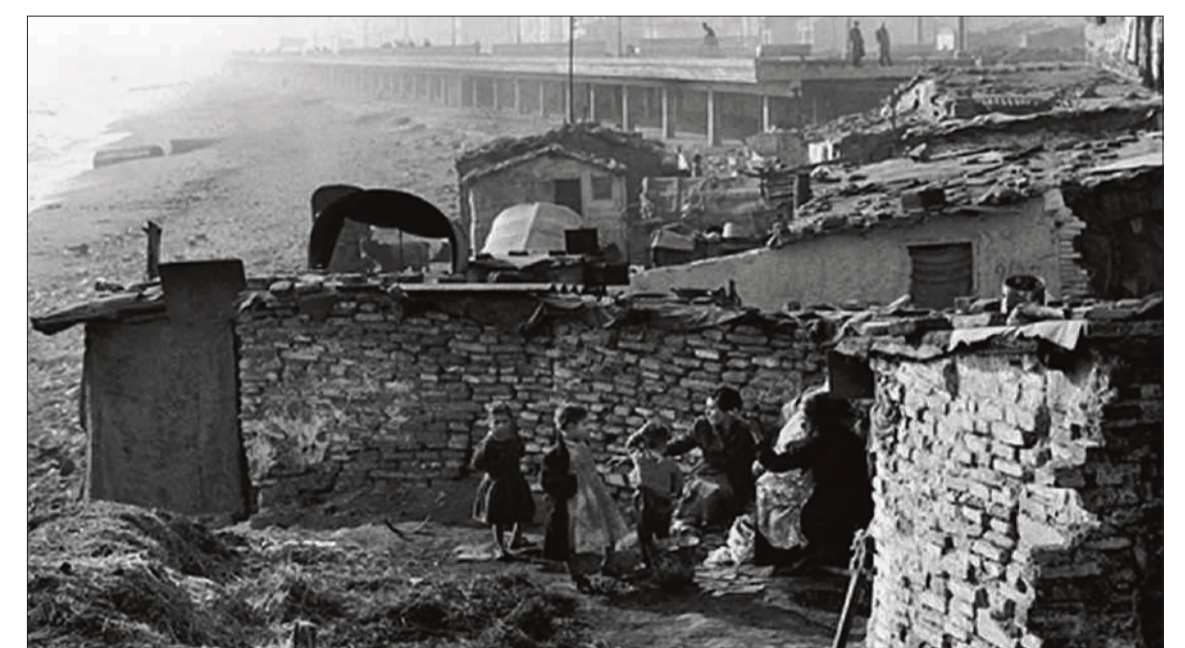
Les barraques del Somorrostro l'any 1962. Al fons de la imatge, el primer passeig Marítim

avui dita del Somorrostro. Amb aquesta nova via, la població es va reduir en més d'un terç. El 9 de novembre de 1964 un nou temporal de llevant va obligar a acollir 642 persones a l'estadi de Montjuïc, el que suposaria un altre cop pel barri de barraques. L'estocada final, però, el donaria el mateix ajuntament franquista quan el juny de 1966 va procedir a enderrocar les 600 barraques que hi restaven en un sol dia. El motiu oficial va ser que al cap d'uns dies s'hi feien unes maniobres navals i aquell espectacle inhumà no podia ser captat per les càmeres de la premsa convocada. En aquesta evacuació definitiva, els 3000 barraquistes foren traslladats al barri badaloní de Sant Roc; alguns, en pisos nous, i la majoria en barracons construïts a l'efecte, mentre se n'edificava la resta. Potser us pregunteu: què té a veure això amb el Poble-sec? En