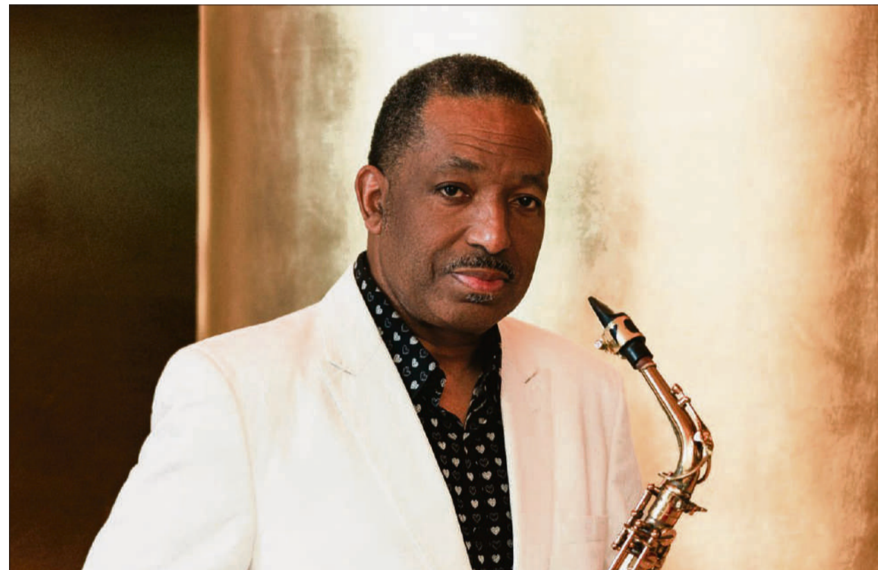
Donald Harrison convertirà El Molino en un club de jazz de Nova Orleans

Entre l'extensa programació de la mítica sala, destaca el concert del 8 de novembre, en el qual el saxofonista de Nova Orleans Donald Harrison buscarà transformar l'espai en un club de jazz de la seva terra natal. En paral·lel, la llegenda del jazz