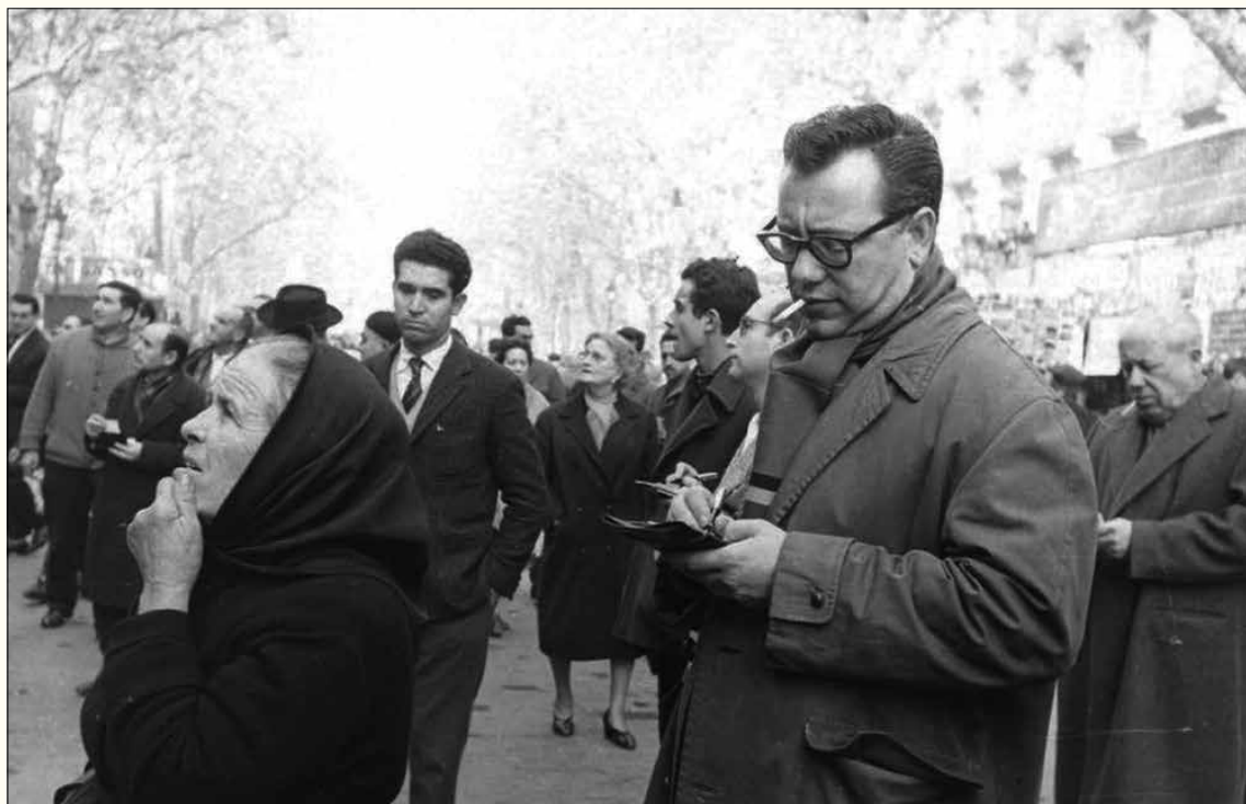
1961. Esperant el premi de la loteria de Nadal a la Rambla