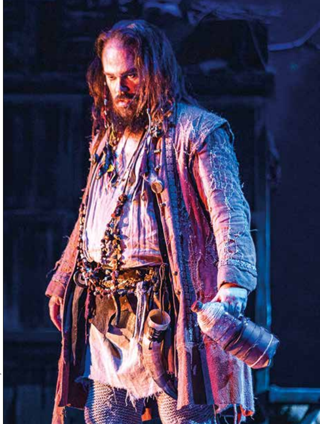
En el paper de Barber al musical 'El Médico' a l'Apolo

“La meua feina és un èxit perquè hi treballo cada dia, i sé que molta gent desitjaria poder fer el que faig. Em considero afortunat”