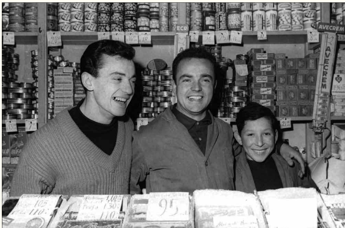
1964. Guanyadors de la loteria de Nadal