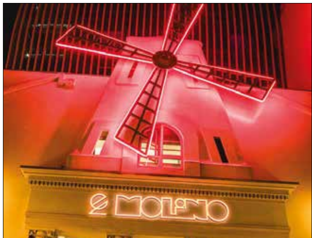
La nova imatge nocturna d'El Molino

Entre els artistes de jazz que encapçalen el cartell destaquen noms internacionals de gran prestigi com: Donald Harrison, Eliane Elías, The Kahil El Zabar Quartet,