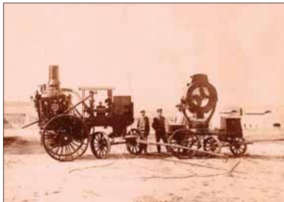
Reflector del Tibidabo i la maquinària per transportar-lo

Els del Palau Nacional no van ser els primers reflectors elèctrics amb finalitats espectaculars de Barcelona. La referència més antiga que trobem a les hemeroteques és del 10 de març de 1908, quan es va instal·lar un al Tibidabo, amb motiu d'una visita d'Alfons XIII. L'any 1909