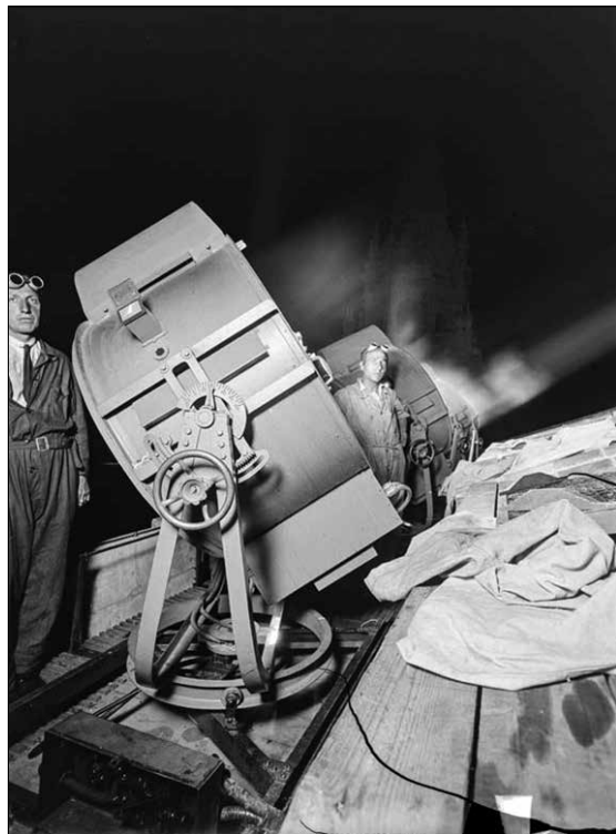
Operaris amb els reflectors durant l'Exposició Internacional

L'efecte lluminós dels focus era molt més imponent que avui en dia gràcies a la baixa contaminació lumínica de l'època. Això permetia que els raigs fossin visibles a més de 100 Km de Barcelona. El moment més impactant protagonitzat pels focus durant l'Exposició va tenir lloc la nit del 23 d'octubre de 1929, amb la visita del Graf Zeppelin , el dirigible més gran del món. El seu vol sobre Montjuïc il·luminat pels reflectors del Palau Nacional, va embadalir els barcelonins. Els reflectors es van conservar un cop acabat l'esdeveniment, convertint-se en un símbol de l' skyline nocturn de Barcelona. Durant un temps fins i tot van fer projeccions de colors, abans de servir com a focus antiaeris a la Guerra Civil. HISTÒRIES DE BARCELONA