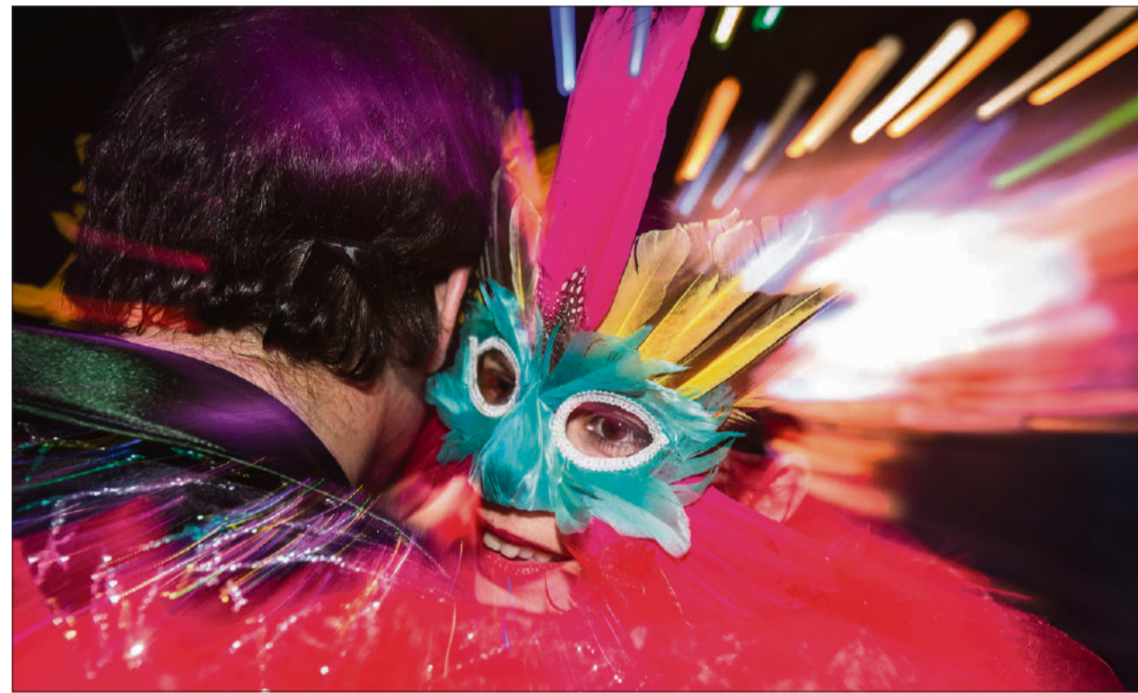
La Rua de Carnaval se celebrarà divendres 28 de febrer