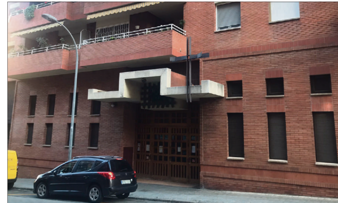
L'actual església de Sant Pere Claver, al carrer Palautàries