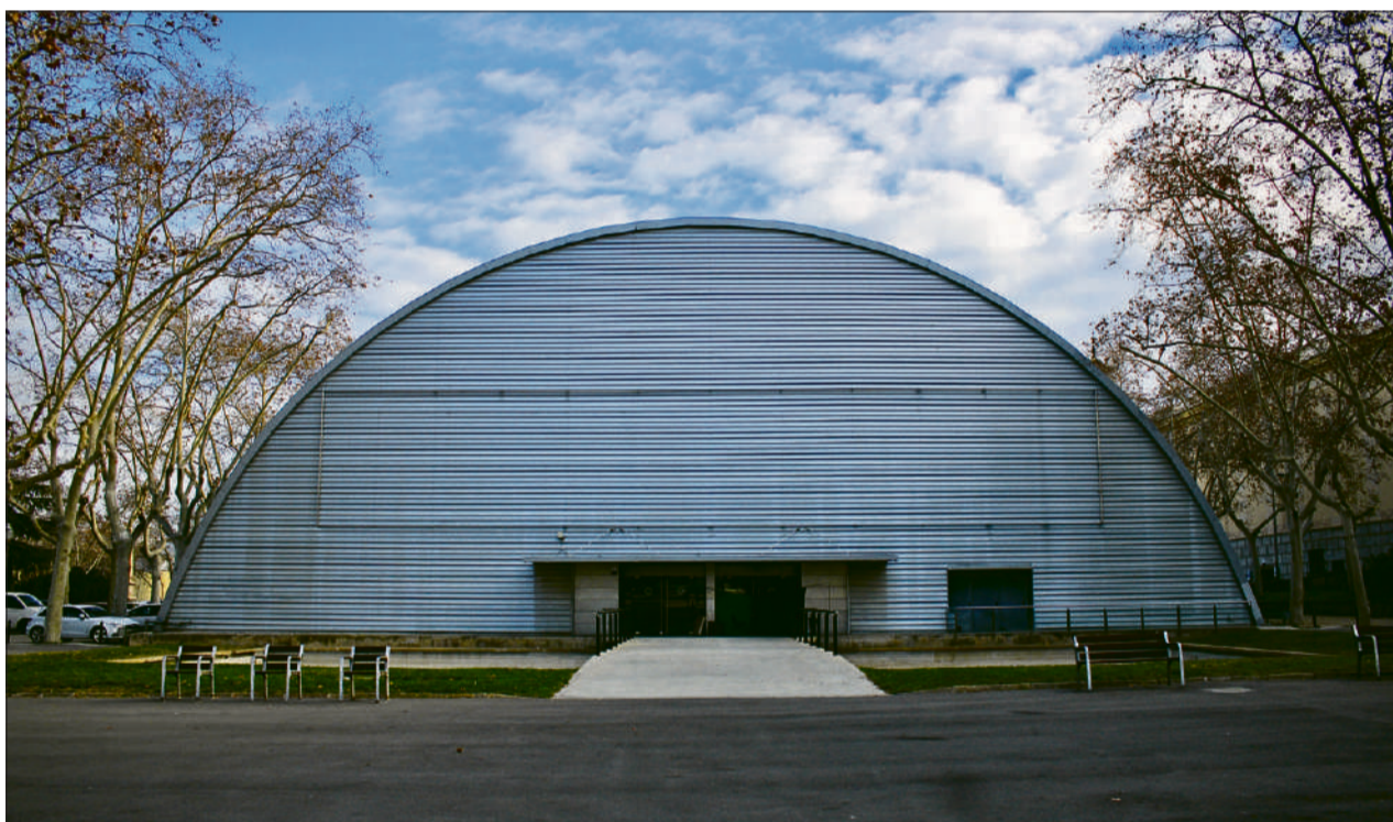
L'edifici dels anys vuitanta serà enderrocat quan s'hagin reubicat els col·lectius que avui dia el fan servir

CALENDARI El consistori admet que no té cap pla a curt o mitjà termini per dotar a les entitats d'un edifici definitiu P. 3