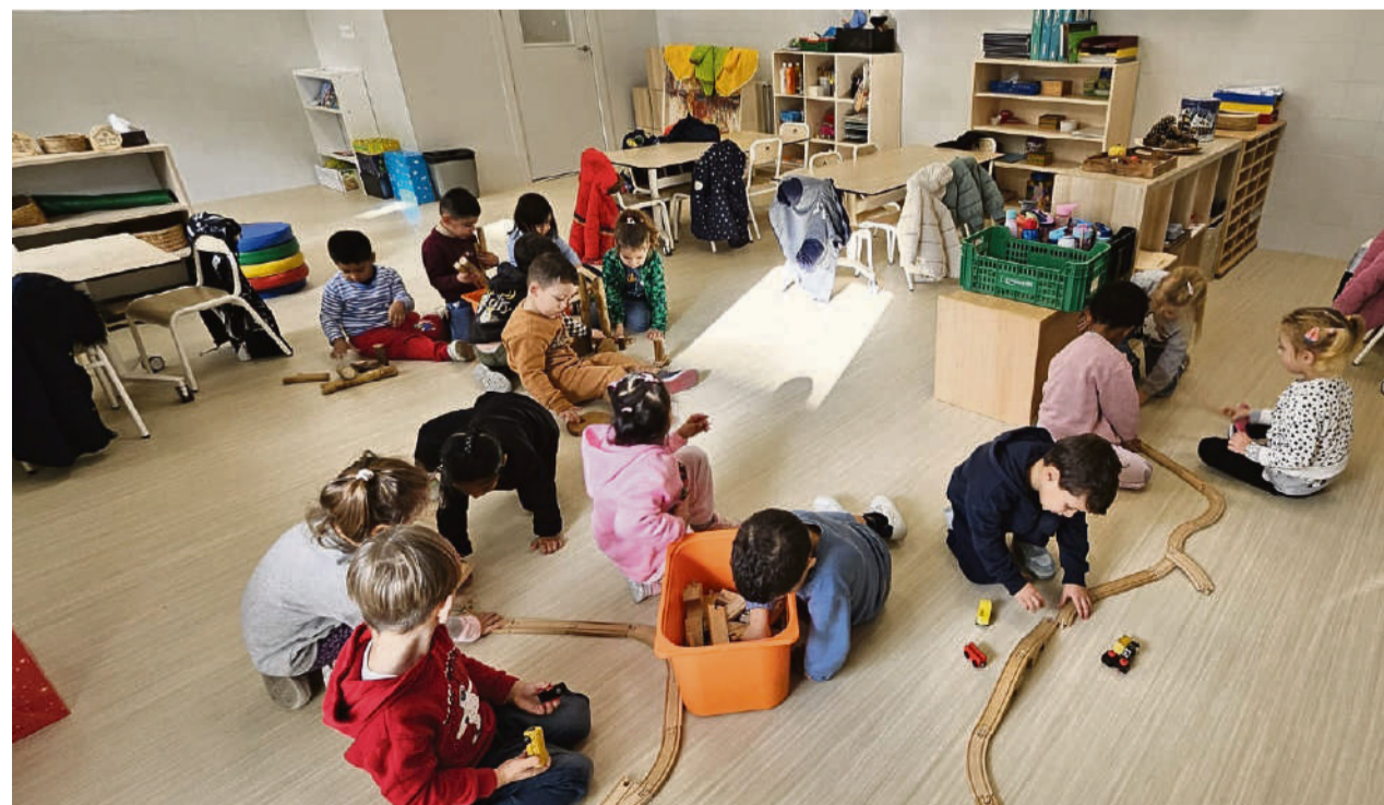
El centre educatiu es troba ubicat al carrer de Blasco de Garay, 52

Cada pas que fem a Maristes Anna Ravell està guiat pel nostre compromís amb una educació de qualitat. Respectem el ritme de cada infant i treballam per transmetre valors essencials com el treball en equip, la solidaritat i la creativitat. Sabem que estem apostant pel futur dels nostres nens i nenes, i aquesta és una responsabilitat que assumim amb il·lusió i determinació. ●