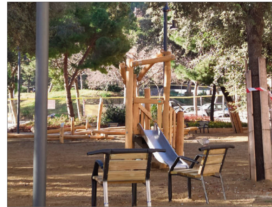
Nous jocs infantils a la zona verda reformada

● El resultat del parc és fruit del procés participatiu amb veïns i alumnat de la zona