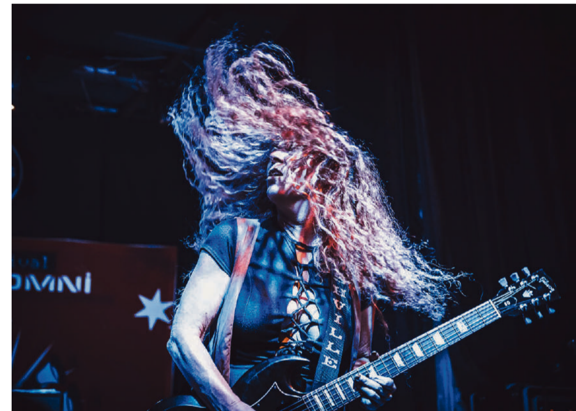
Nashville Pussy actuarà al Book Music Festival