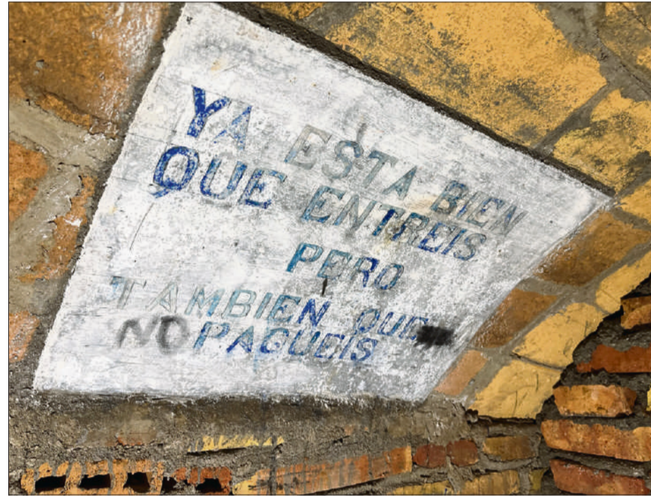
El refugi conserva trets originals, com aquest que convida a col·laborar econòmicament. AJUNTAMENT DE BCN

● De seixanta metres de longitud, té accés pel carrer de Piquer, però no es pot visitar