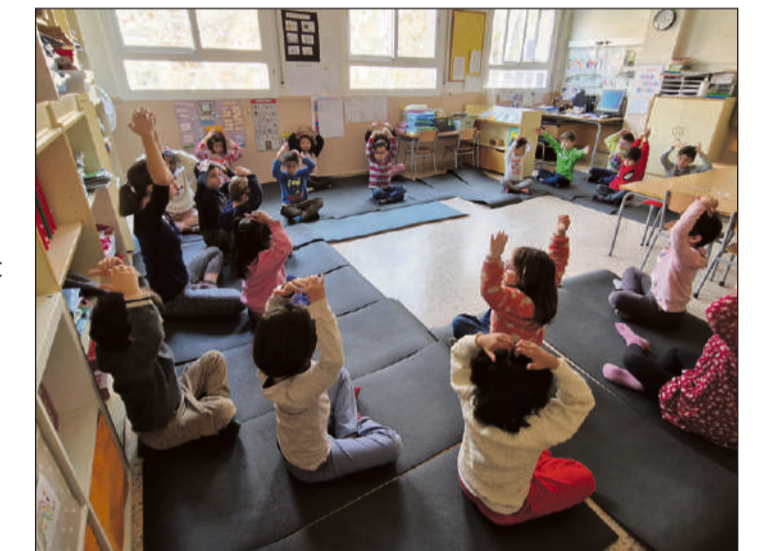
Sessió de mindfulness en una de les aules del centre

dinamitzacions relacionades amb el gust per la lectura o la cura per una alimentació equilibrada, considerem que la part emocional és un pilar essencial per la formació d'una persona que no podem oblidar", assenyala la directora del centre. Tot plegat, per fer una passa endavant amb el primer article de la Constitució de l'OMS: "La salut és un estat de complet benestar físic, mental i social, i no només l'absència d'afecions o malalties". •