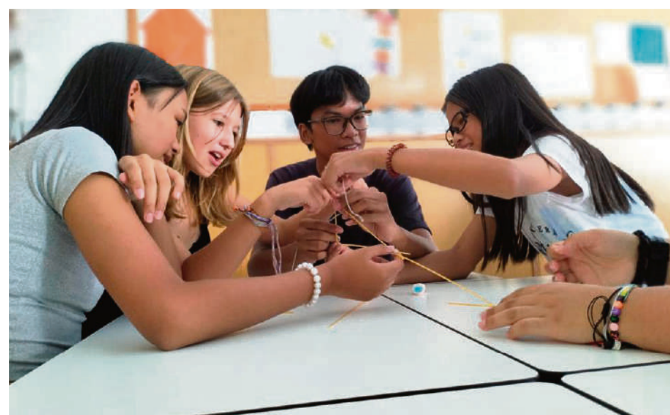
El centre educatiu es troba ubicat al carrer de Blasco de Garay, 52

ESO i Batxillerat) Pots triar la modalitat de la visita i t'atendrem de forma personalitzada: En horari lectiu i amb l'escola amb plena activitat (de 9 a 17h), fora de l'horari lectiu o el dissabte 8 de març (matí). Truca'ns: 934425027 o visita la nostra web: annaravell.maristes.cat