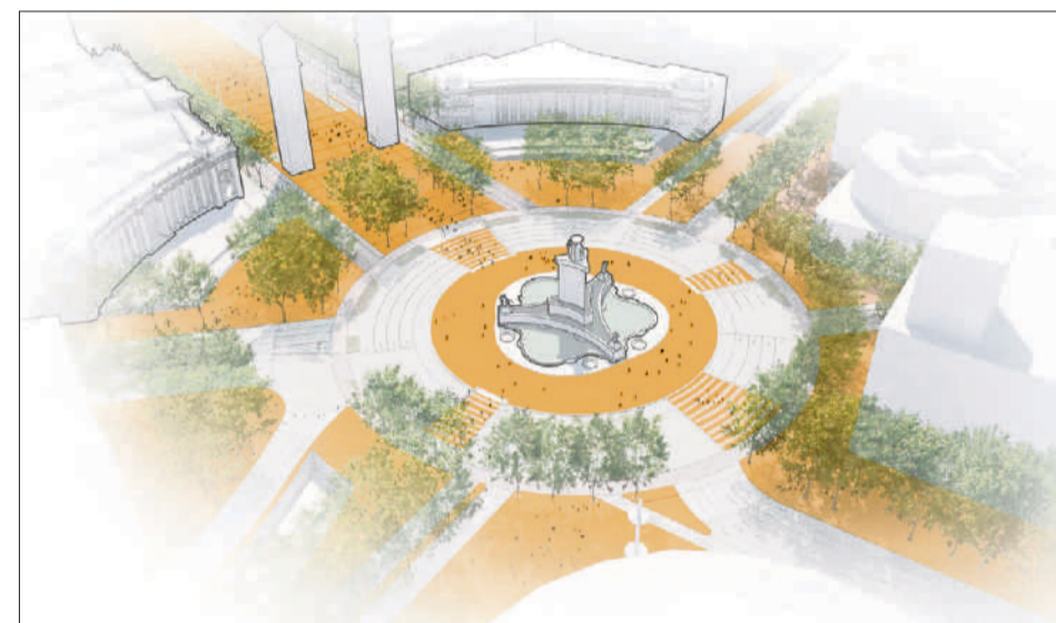
La plaça d'Espanya serà pels vianants un cop estiguin tots els projectes enlestits AJUNTAMENT DE BCN

● El Poble-sec aplegarà la majoria dels projectes a desenvolupar fins l'any 2035