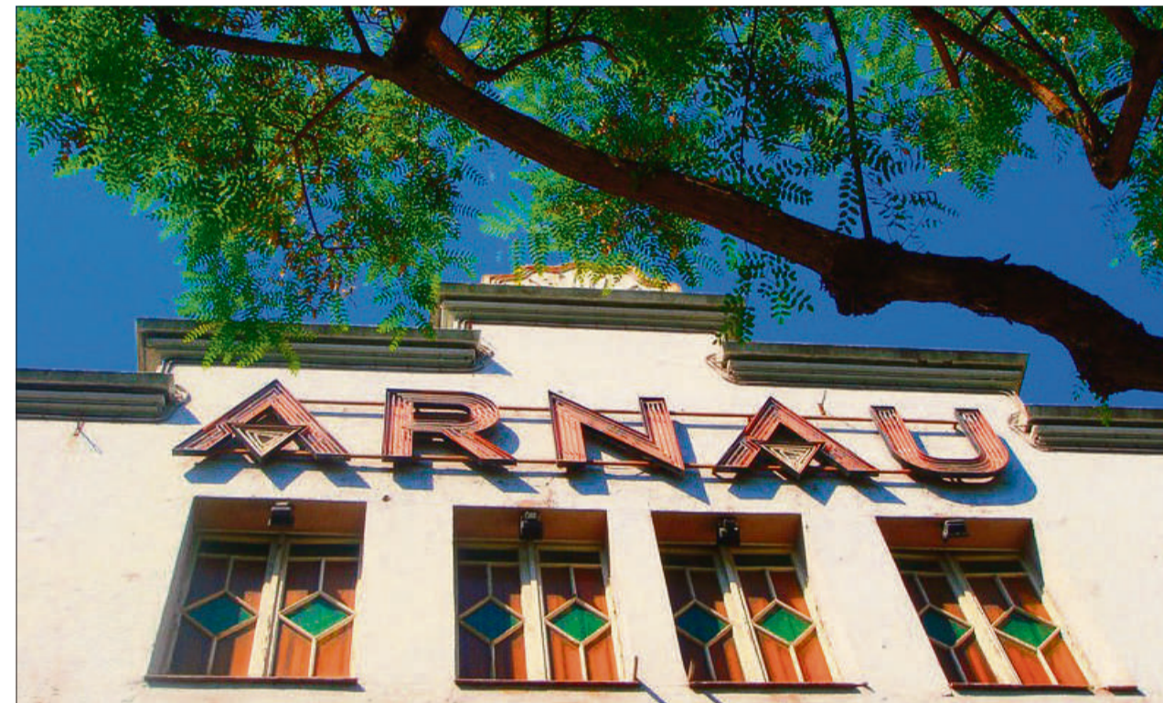
El nou edifici no comptarà amb la planta soterrada per tal d'ajustar el pressupost