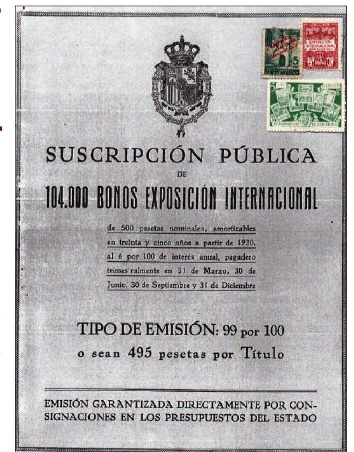
Portada de l'emissió dels bons amb tres segells de correus