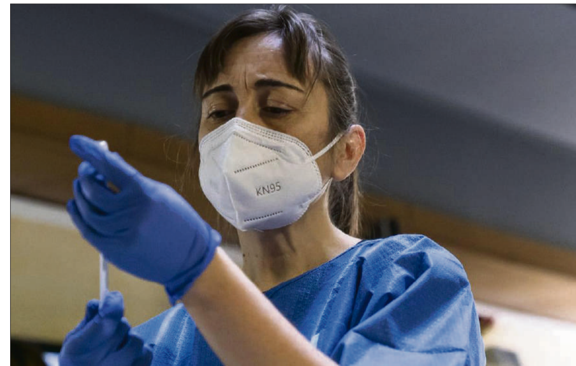
Les mascaretes van passar a formar part del dia a dia de la població